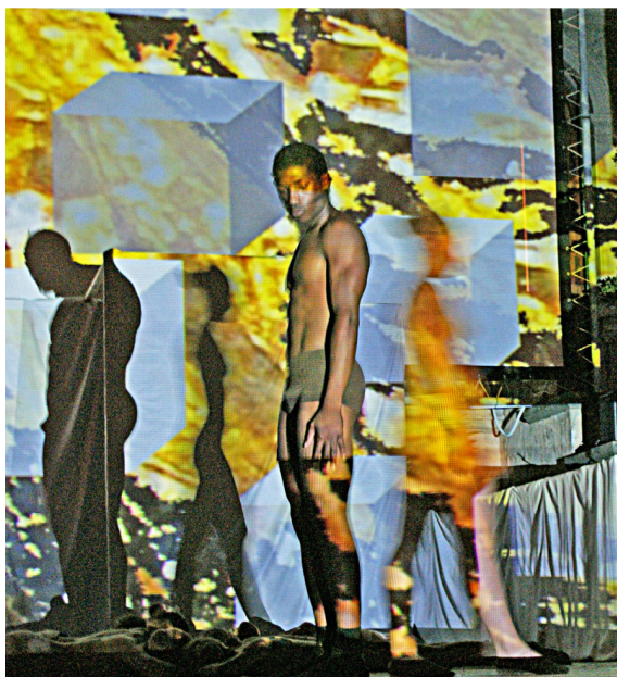
Tav. VIII: "CRA-INITS Evocazioni Dantesche (Immagine, Danza, Musica e Parola) ©"

Comunemente difatti si dice che il purgatorio sia il luogo dove le anime cercano proprio il dolore, quasi che fosse una medicina; ma questo stesso concetto è limitato e limitante. Il Dio d'Amore — l'Amore — per sua medesima costituzione dolcissima non può volere il nostro dolore.